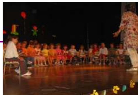
Ukázka výuky v Italské škole, v hale, která je součástí každé školy

V Udine ve Via des Macilis jsem bydlel a chodil i do školy. S kámošema jsme k večeru hráli fotbal, bylo to tam prima. Ve školce je také 5 tříd, hrajou se tam různé hry a učí se tam angličtina. Skoro v každé školce je písek. Ve