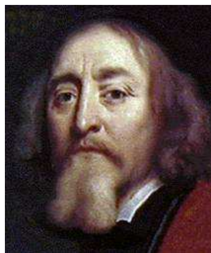
Jan Amos Komenský (1592- 1670)