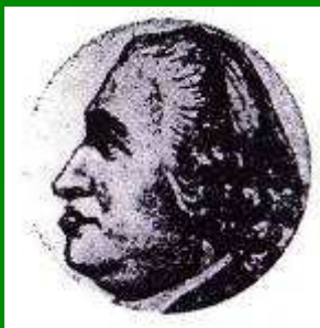
J. I. Felbiger (1724 - 1788)

„Školskou reformu pro Marii Terezii vypracoval J. I. Felbiger - ve všech rakouských zemích byla zavedena šestiletá povinná školní docházka.“