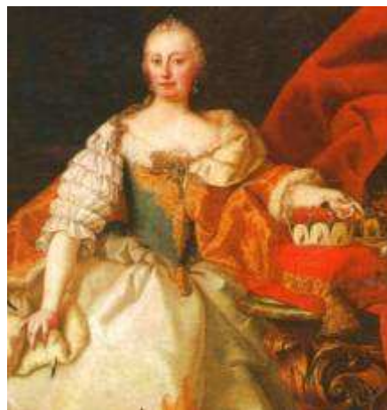
Císařovna Marie Terezie (1717 - 1780)