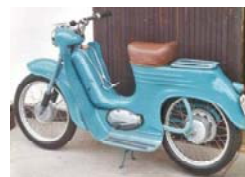
Jawa Pařez typ 555

Pionýr koncepčně a konstrukčně daleko předběhl konkurenci v této kategorii a zůstal díky svým dobrým vlastnostem po mnoha modernizacích ve výrobě až do počátku 80. let.