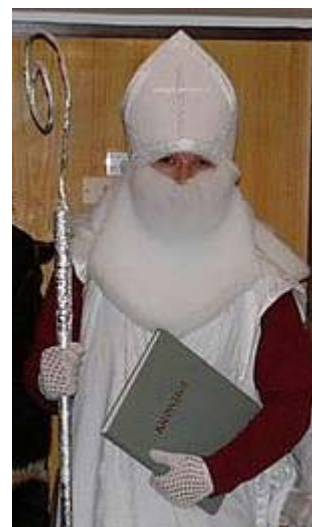
Pan ředitel při Mikulášské nadílce jde pochválit žáky