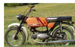
Jawa 23 Mustang

„Tyto motorky začaly mít přezdívkou pionýr neboli pincek, fichtl nebo fekál - zřejmě kvůli smradu dvoutaktního motoru :-))“