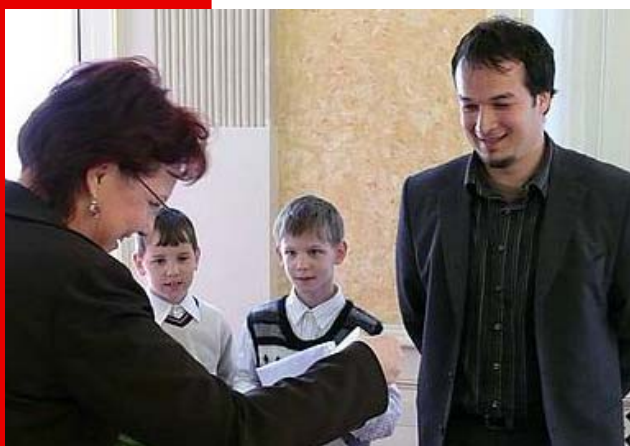
Pan ředitel při návštěvě u ministryně školství

„Být prospěšný a spokojený, rozšířit a budovat silnou horskou školu (máme co nabídnout).“