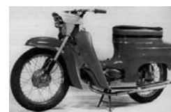
Jawa Pionýr typ 20