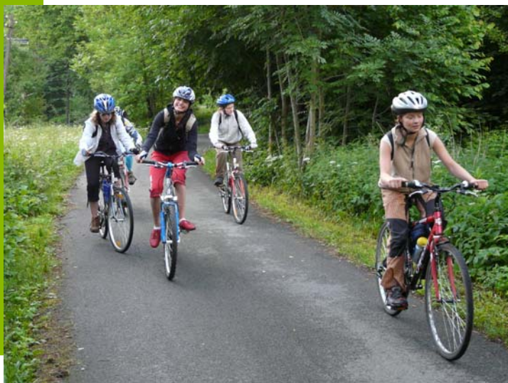
Foto z výletu

Přejeme Základní škole Dobřany hodně úspěchů a aby se jí dařilo aspoň tak, jako poslední tři roky. S láskou na ni budeme vždy vzpomínat, protože si myslíme, že to zřejmě byly nejlepší léta našeho života. Nikdy na to nezapomeneme.