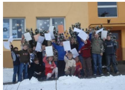
Radostné mávání vysvědčením žáků 2. a 4. ročníku :-)

Ústní hodnocení? Výborné řešení, ale známka je v nás takovou tradicí, že cokoliv jiného vždycky vypadá tak trochu podezřele. Učitel začíná podléhat panice. Jak tedy nejlépe? Průměrem známek?